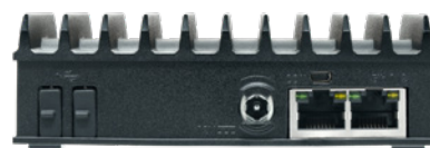
Takapaneeli 2 x RJ45 2 x USB-A